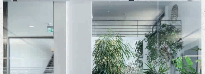
Bureau Fielitz - Ingolstadt