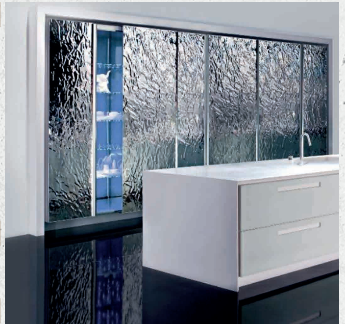
Agencement cuisine - Regba Design