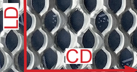
Maille représentée à l'échelle 1:1 10 mm